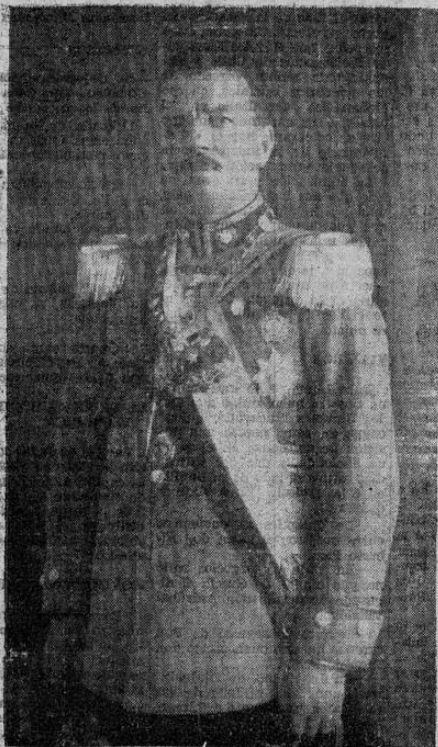
Excmo. señor Presidente de Chile, General don CARLOS IBAÑEZ DEL CAMPO

Por hallarse instalada en medio de las soledades y lejos de los valles y llanuras donde habitan las muchedumbres, este monumento podría denominarse el "Cristo Solitario"; pero es en verdad el "Cristo de la Amistad", porque con el efflujo de su magnificencia e infinita bondad ha enlazado para siempre a dos pueblos hermanos con el vínculo de la cordialidad.